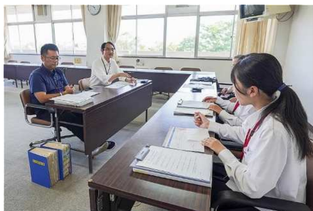
市役所の人に聞く